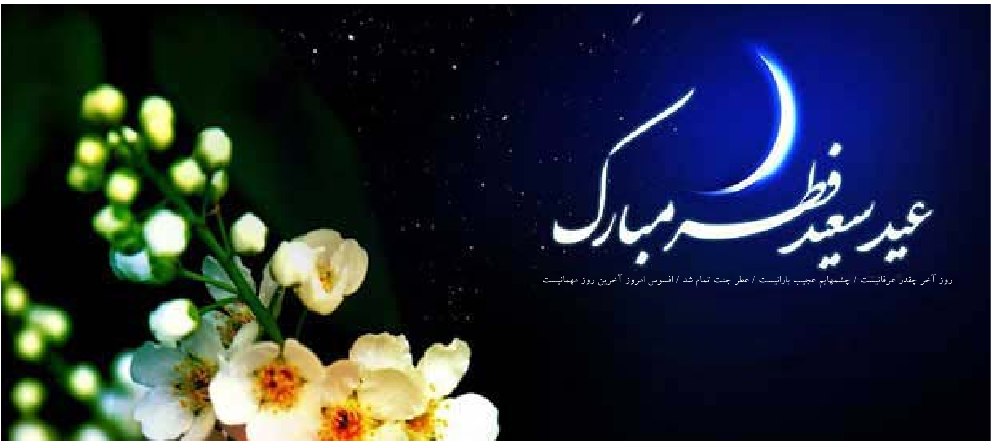
روز آخر چقدر عرفانیست / چشمه های عجیب بارانیست / عطر جنت تمام شد / افسوس امروز آخرین روز مهمانیست

«ای مردم! همانا این روز شما، روزی است که در آن نیکوکاران پاداش می یابند و هرزه کاران زیان می بینند و شباهت بسیاری به روز رستاخیز شما دارد. پس، با بیرون آمدن از خانه های خود به سوی مصلایتان به یاد آن روزی افتید که از گورهایتان به سوی پروردگارتان بیرون می آید و از ایستادن در مصلایتان به یاد آن